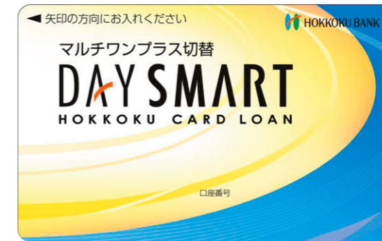
上記イメージのカードをご郵送します