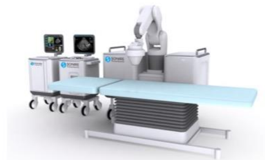
次世代型超音波ガイド下 HIFU 治療装置 (イメージ図)

※HIFUの多点照射により発生させた気泡を活用して患部を加熱し、がん細胞を壊死させる治療。