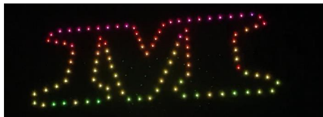
M-1 グランプリでのオープニング演出

ドローンショーは、ソフトウェアエンジニアの他、ハードウェアエンジニアも自社で雇用しており、機体の製造・メンテナンス・修理を、自社内で一貫して提供することが可能です。今後は、軽量さと堅牢性と共により、長時間安定飛行可能、かつ演出上の仕様が強化された、競争優位性の高い機体開発を行う予定です。加えて、アニメーション制作を自社で手掛けることで、より表現力の高い演出を可能にしています。