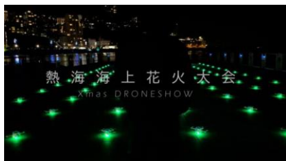
熱海会場花火大会での演出

株式会社ドローンショー（以下 ドローンショー）は、国内初のドローンショーの開発、企画・運営を手がけ、アート、サイエンス、テクノロジーを融合した、革新的なエンターテインメントを提供しているスタートアップ企業です。同社は、ドローンを用いた航空ショーを国内で最も早く取り入れ事業化し、日本一の漫才師を決定する大会『M-1 グランプリ』でのオープニング演出や静岡県で開催された熱海海上花火大会での演出を担当した、ドローンショー分野における国内最大手級の企業です。また、石川県発のスタートアップ企業として、地方創生に向けた取り組みも積極的に行っています。