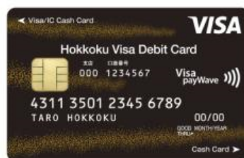
北國Visaデビットカード